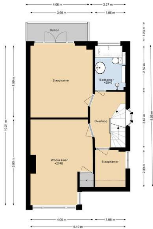
WITTENBURGERWEG 90 1E VERDIEPING

DEZE PLATTEGRONDEN ZIJN MET DE GROOTSTE ZORG SAMENGESTELD EN BIJEN TER RICHTIGE ER KUNNEN GEEN RECHTEN AAN WORDEN ONTLEEND. © WWW.GROENHUISBOUW.NL